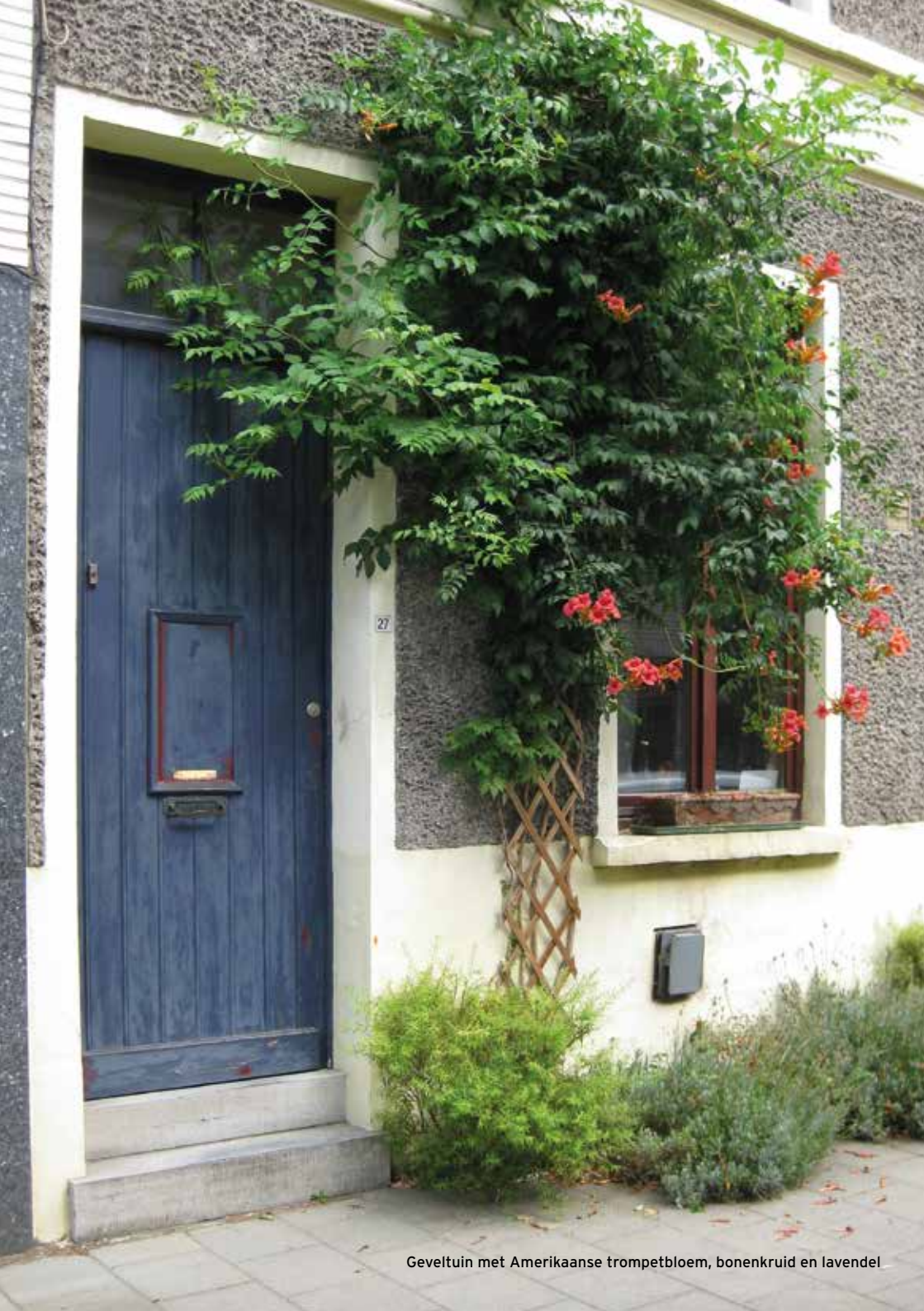
Geveltuin met Amerikaanse trompetbloem, bonenkruid en lavendel