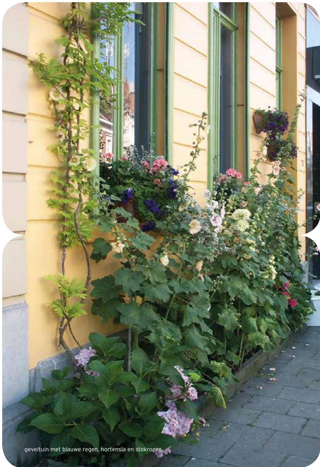
geveltuin met blauwe regen, hortensia en stokrozen.