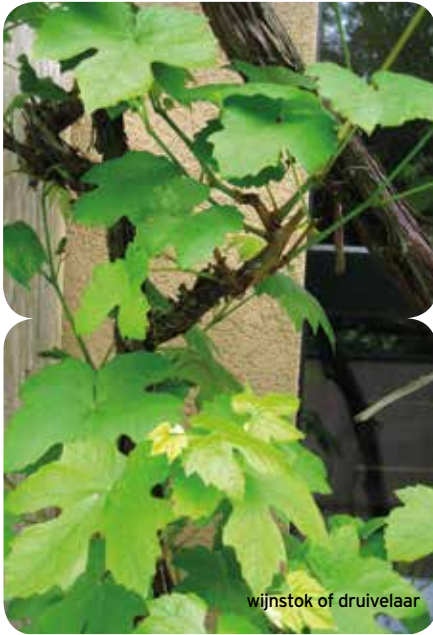
wijnstok of druivelaar

Rankers zijn planten die tak- of bladranken maken waarmee ze zich omhoogtrekken. Druif (wijnrank) en bosrank zijn rankers. Ze hebben een klimhulp nodig. Dat is liefst een traliewerk met mazen van ongeveer 15 cm x 15 cm. Voor een wijnrank mag de maasgrootte 40 cm x 40 cm zijn. De buisjes zijn bij voorkeur rond met een diameter van maximaal 3 cm.