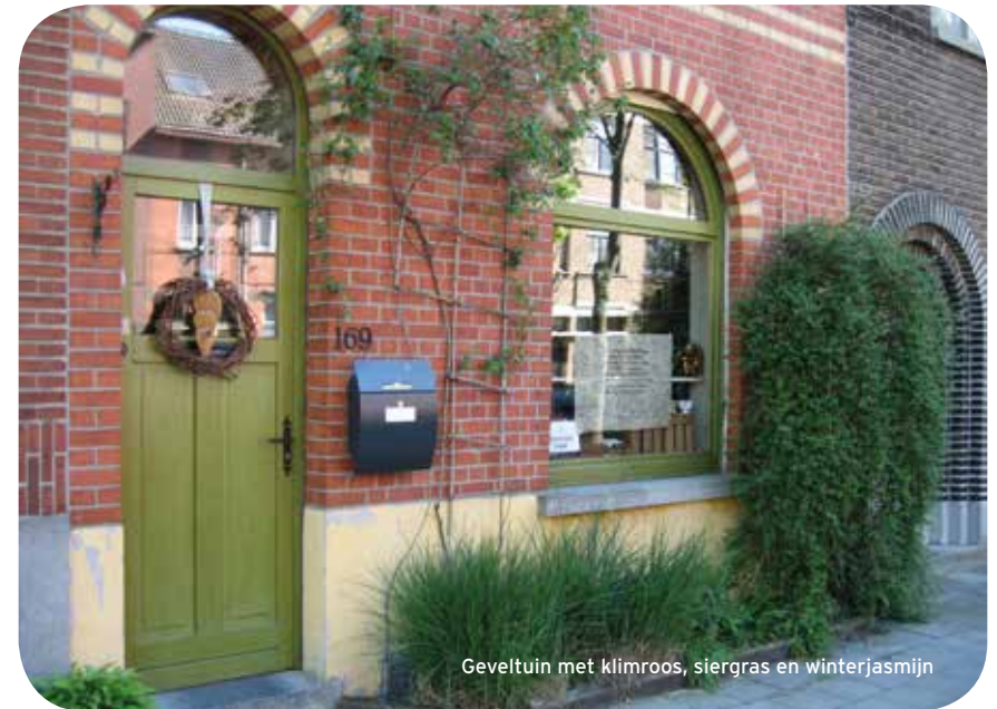
Geveltuin met klimroos, siergras en winterjasmijn