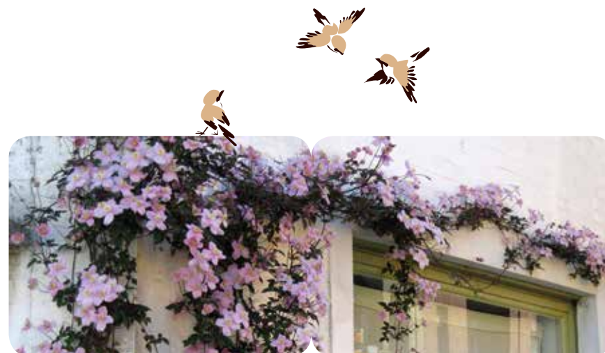
bergbosrank of clematis