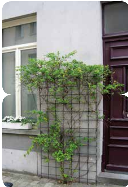
kamperfoelie tegen tralierooster

De bevestigingshaken en draadspanners zijn bij voorkeur uit roestvrij materiaal vervaardigd. Anders komt op termijn de klimhulp mét de klimplant naar beneden.