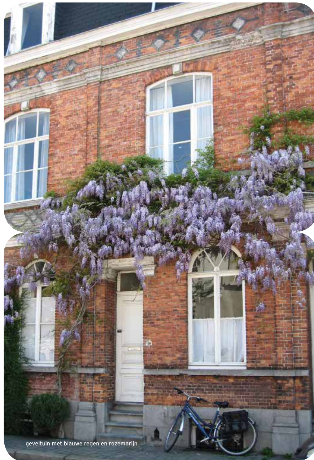
geveltuin met blauwe regen en rozemarijn