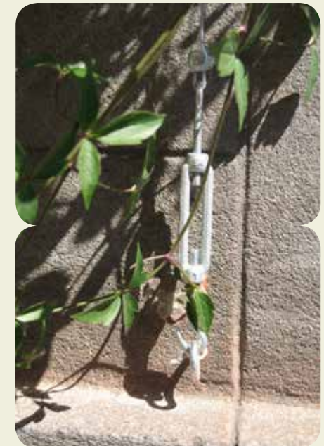
Van onder naar boven zie je: de oogvijs, de spanschroef en de draadklem.